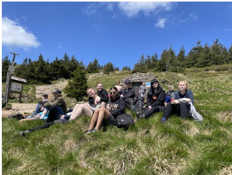
Zpracovala Mgr. Blanka Cahová, garant zeměpisu