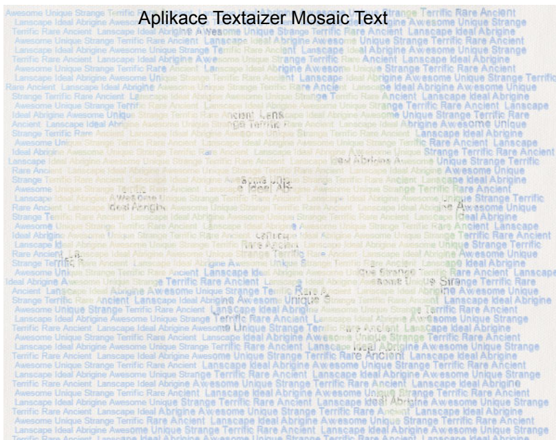
Aplikace Textaizer Mosaic Text